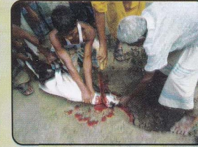
সাবধানে গবাদিপশু জবাই এর দৃশ্য