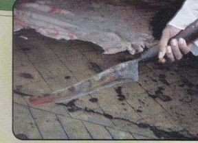
জবাই এর জন্য ব্যবহৃত ছুরি