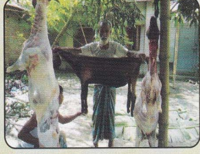
ছোট পশুর চামড়া ছাড়ানোর দৃশ্য