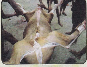
বড় পশুর চামড়া ছাড়ানোর দৃশ্য