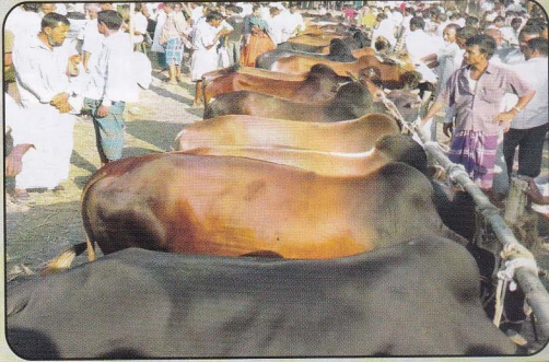
ঈদ-উল-আযহার কোরবানীর হাটের সাধারণ দৃশ্য

আমাদের দেশে প্রাপ্ত চামড়ার এক উল্লেখযোগ্য অংশ ঈদুল আযহার সময় পাওয়া যায়। এ সময় হস্তপুষ্ট পশু থেকে উন্নতমানের চামড়া পাওয়াটাই স্বাভাবিক। কিন্তু পশুদেহ থেকে সঠিকভাবে চামড়া ছাড়ানো এবং রক্ষণাবেক্ষণ করা হয় না বলে চামড়ার মান আশানুরূপ উন্নত হয় না। ফলে চামড়ার উপযুক্ত দাম পাওয়া যায় না। তাই দেশবাসীকে চামড়ার মান উন্নয়নে সচেতন করে তোলা উচিত।