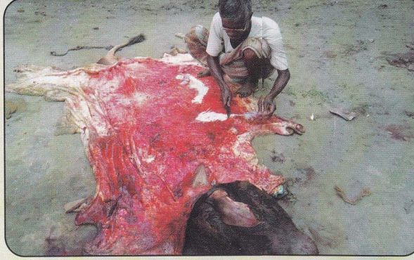
চামড়ায় লেগে থাকা অতিরিক্ত গোশত, চর্বি এবং বিভিন্ন উঠিয়ে ফেলার দৃশ্য

চামড়া সঠিকভাবে সংরক্ষণ করা 'আমার, আপনার সকলের' দায়িত্ব। চামড়া একটি মূল্যবান জাতীয় সম্পদ। এ সম্পদ সুষ্ঠুভাবে সংরক্ষণের মাধ্যমে এবং বাজারজাতকরণের ফলেই উপযুক্ত মূল্য পাওয়া যায় এবং বৈদেশিক মুদ্রা অর্জনে সহায়ক হয়।