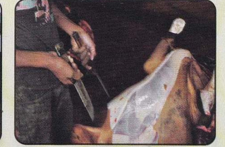
চামড়া ছাড়ানোর জন্য ব্যবহৃত ছুরি