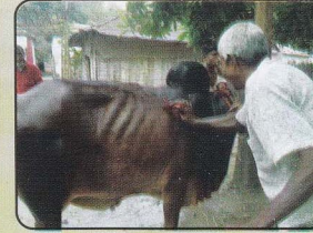
জবাই এর পূর্বে গবাদিপশুর পরিচর্যা